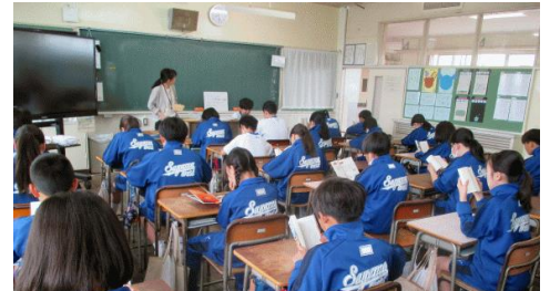
机上に余計なものを一切置かず姿勢よく読書ができています

さて、生徒の登校時刻に合わせて裏門の交通安全指導に立っていますが、「おはようございます」の挨拶ができる生徒が今年が多いと感じています。特に自分から進んで「先手挨拶」ができる生徒が多いです。そしてほぼ例外なくすべての学級で、8:25から始まる朝読書が静かに集中してできています。挨拶を交わすことは、よりよい人間関係づくりや集団生活の根本となる大切なものです。また朝読書の時間は、読書を通して心を豊かにすることだけでなく、1日の学校生活を落ち着いてスタートさせるために最も重要な時間の一つと位置づけています。新年度になりみなさんの前向きな気持ちが目に見える形となって現れています。その気持ちと行動をいつまでも大切にしていってください。