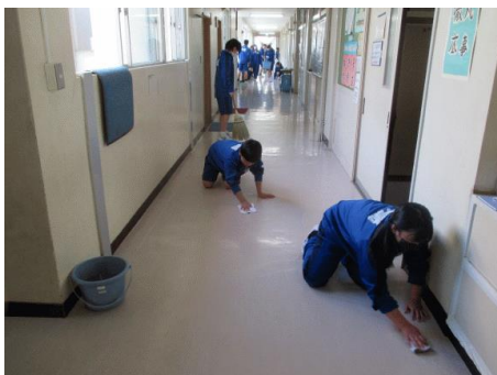
1年生も無言で丁寧に清掃に取り組んでいます

個人の努力は、「足し算」と言われています。例えば問題集を毎日2ページやることにすると、2日目には2+2で4ページ、3日目には2+2+2で6ページに、これを1年間やり遂げればおよそ700ページになります。最初に「700ページの問題集をやるぞ」と思っても「無理だよ」と思うかもしれませんが、小さな目標やノルマを掲げ、こつこつと継続することができれば大きな成果を成し遂げられます。だから小さな努力をコツコツと積み重ねる足し算の努力を大切にしてください。